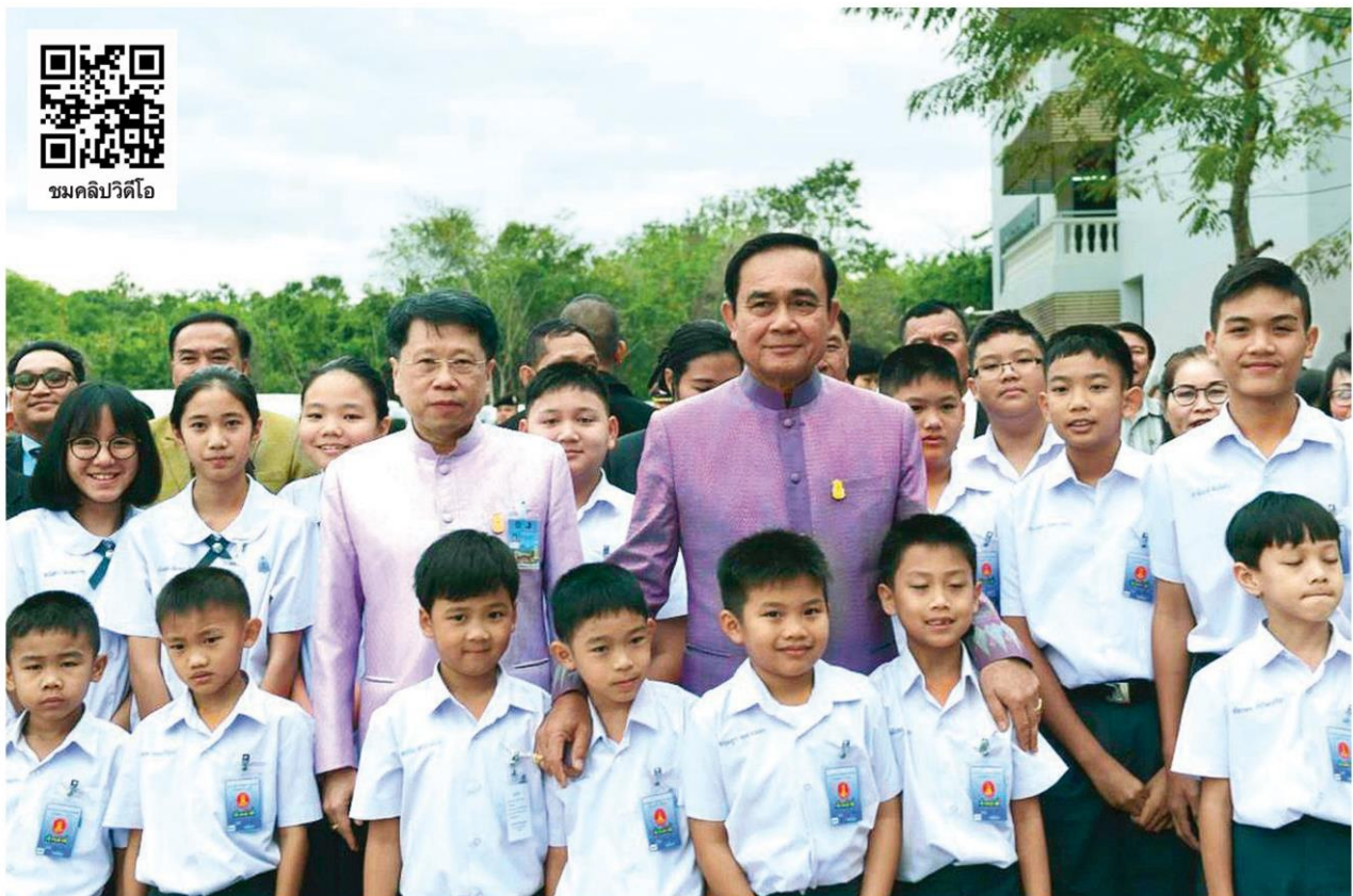
อบอุ่น - พล.อ.ประยุทธ์ จันทร์โอชา นายกรัฐมนตรี และหัวหน้าคณะรักษาความสงบแห่งชาติ (คสช.) ถ่ายรูปร่วมกับนักเรียนที่มารอต้อนรับ ก่อนเป็นประธานประชุมคณะรัฐมนตรีอย่างเป็นทางการนอกสถานที่ ที่มหาวิทยาลัยขอนแก่น วิทยาเขตหนองคาย จ.หนองคาย เมื่อวันที่ 13 ธันวาคม

เมื่อถามกรณีที่น่ายทักมึน ชินวัตร อดีต นายกรัฐมนตรี เสนอแก้ไขรัฐธรรมนูญปี 2560 ไม่ให้ ส.ว.มีสิทธิเลือกนายกฯ พร้อมให้ยกเลิกยุทธศาสตร์ชาติ 20 ปี พล.อ.ประยุทธ์กล่าวว่า ใครพูดก็ไปถามเขา มันจะแก้ได้อย่างไร กว่าจะเป็นรัฐธรรมนูญฉบับนี้ได้มันผ่านอะไรมาบ้าง วันนี้รัฐธรรมนูญใช้แล้วหรือยัง ซึ่งไม่ได้ใช้อย่างเต็มที่เลย เช่นเดียวกับยุทธศาสตร์ชาติที่ยังไม่ได้เริ่มเลย เหล่านี้ประกาศใช้เป็นกฎหมาย ทำแทบตาย ออกมาแล้วจะบอกว่าให้ยกเลิก เรื่องนี้เป็นหน้าที่ของประชาชน ถ้าเห็นว่าเป็นนโยบายที่ไม่รู้จะทำอย่างไร เพราะเป็นเรื่องของหลักการสากล ทั่วโลกก็ทำแบบนี้