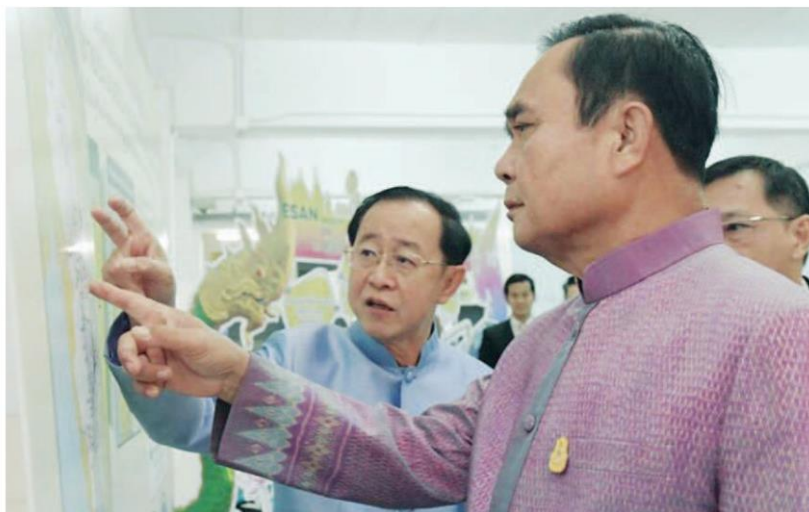
Prime Minister Prayut Chan-o-cha, right, and Transport Minister Arkhom Termpittayapaisith, visit a campus of Khon Kaen University in Nong Khai. The Cabinet, meeting in the Mekong River city, yesterday approved a raft of development measures for the upper part of the Northeast.

Agriculture and Cooperatives Minister Kritsada Bunrat said that amid a decline in both demand and prices for rubber, the Ministry of Agriculture and Cooperatives, Ministry of Transport and the Ministry of Finance have discussed solutions. Possible remedies include the determination of the central construction models and a manual for